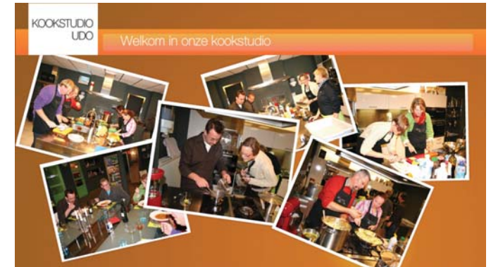
Colour - Orange Shape - rounded