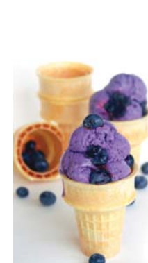
Colour - Green Shape - Block