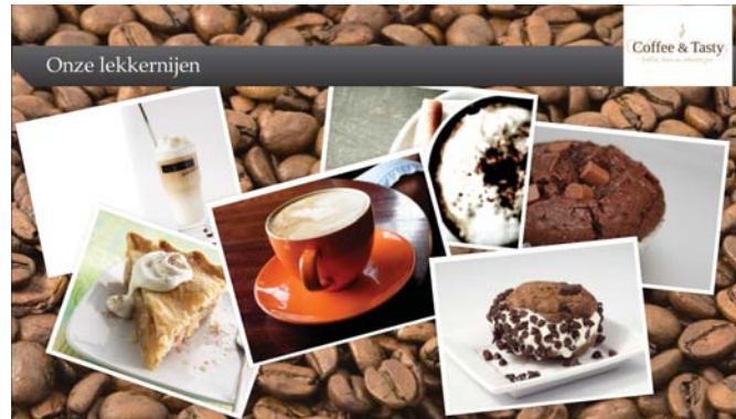
Colour - Black Shape - Angle