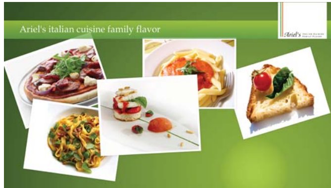
Colour - Green Shape - Block